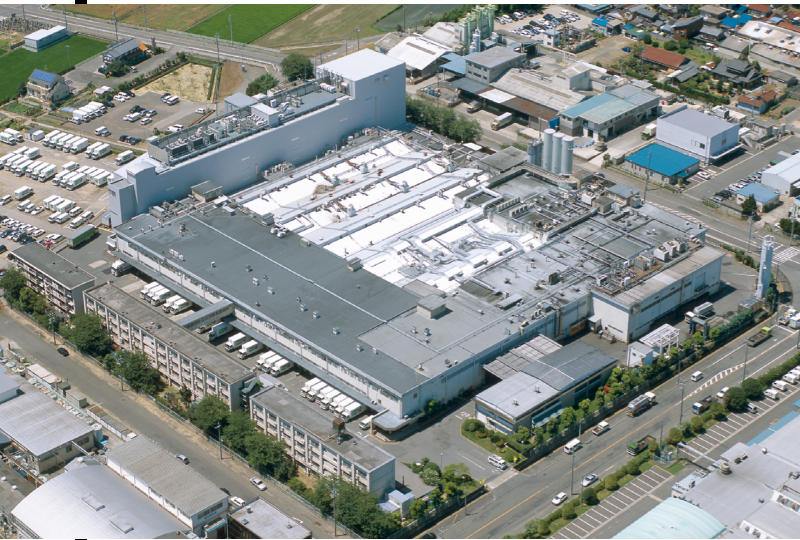
食パン、菓子パンなどの主力製品を製造する敷島製パン・犬山工場