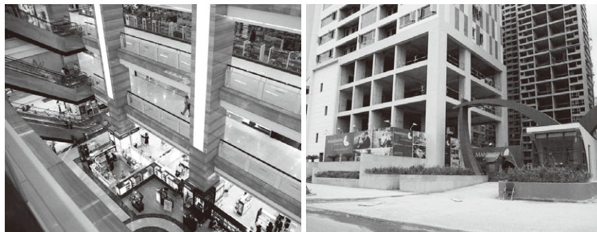
開発途中のままのマンション(右)や、ガラガラのショッピング・センターがあちこちに…

多くはハノイ周辺の工業団地に入居している。ハノイ近郊では、二〇〇〇年くらいから開発が進んだため、現在ほとんどが完売しているが、港町ハイフォンへと続く国道沿いにも工業団地が林立しており、一時間弱ほど東方に向かったエリアなら開発