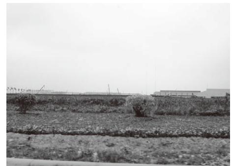
まだまだ開発が続くハノイ周辺の工業団地

ライセンス問題は思った以上に厄介で、たとえば、ある企業はベトナム国内の安価な材料を他のアジア国にある工場で活用しようとしたが、それは材料輸出の商社業務と見なされ、「ライセンスに記載されていない」との理由で許可されなかった。もちろん、ライセンスの変更は申請できるが、そうすると、