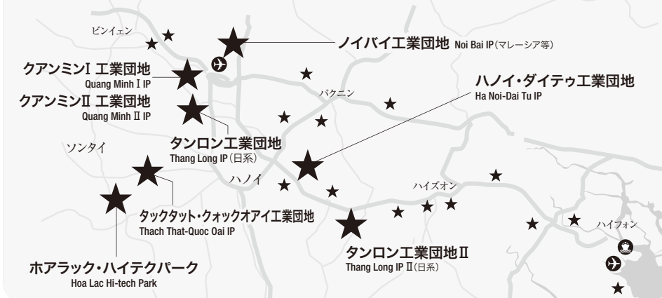
図2■ハノイ周辺の主要工業団地

中の工業団地も多い。また、西部のホアラック・ハイテクパークは、完成すれば、総面積一五八六ヘクタールのベトナム最大の工業団地となる予定だ。単なる工業団地でなく、住居と教育